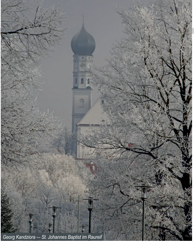
Georg Kandziora — St. Johannes Baptist im Raureif