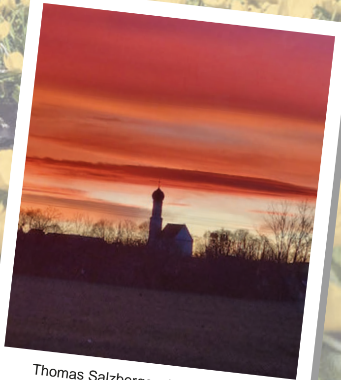
Thomas Salzberger, 1. Bürgermeister